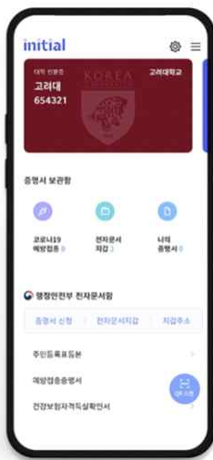
▲ 모바일 학생증 [기본발급]

※ 외국인 학생은 5페이지의 Ⅲ. Non-Financial Student ID (Foreign Students Only) 내용을 참고하시기 바랍니다.